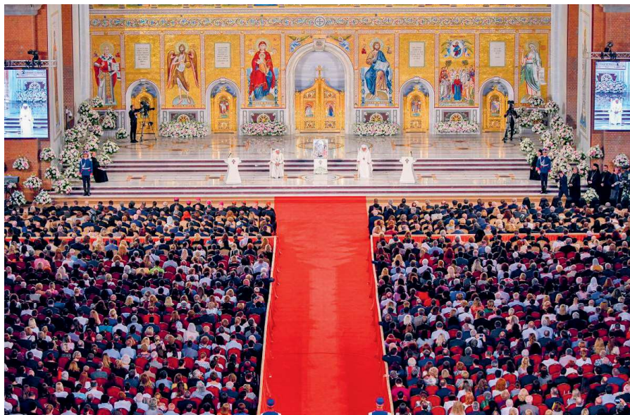
Aspect din timpul întâlnirii solemne din incinta Catedralei Naționale, 31 mai 2019