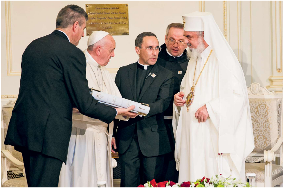
Momente din timpul schimbului de daruri între cele două delegații, „Sala Conventus” a Palatului Patriarbiei, 31 mai 2019