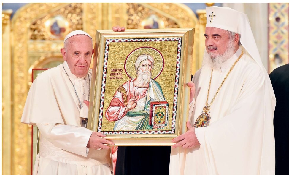
Sanctitatea Sa Papa Francisc primind în dar din partea Preafericitului Părinte Patriarh Daniel, în semn de ospitalitate românească, o icoană în mozaic a Sfântului Apostol Andrei, Ocrotitorul spiritual al României, Catedrala Națională, 31 mai 2019