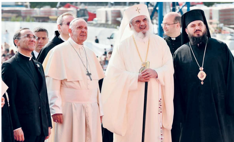
Preafericitul Părinte Patriarh Daniel prezentându-i Sanctității Sale Papa Francisc stadiul la care se aflau lucrările la Catedrala Națională, 31 mai 2019