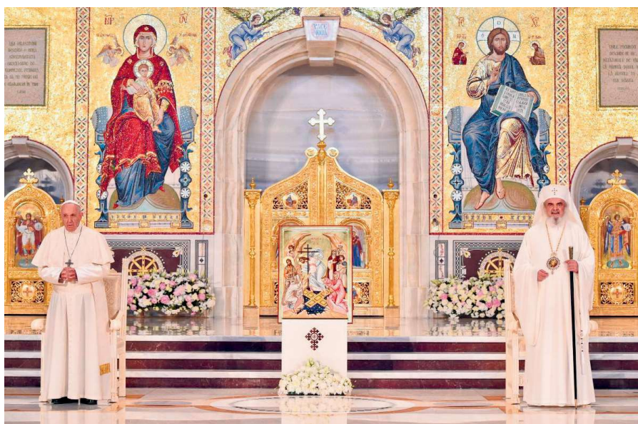
Sanctitatea Sa Papa Francisc și Preafericitul Părinte Patriarh Daniel pe solea Catedralei Naționale, 31 mai 2019