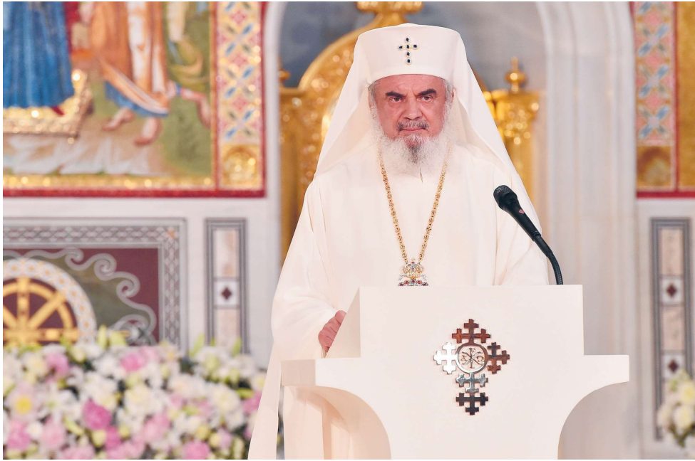
Momente din timpul cuvântului Preafericitului Părinte Patriarh Daniel rostit în cadrul întâlnirii cu Sanctitatea Sa Papa Francisc, Catedrala Națională, 31 mai 2019