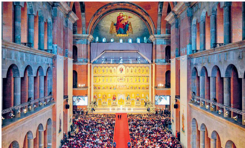
Vedere de ansamblu din timpul întâlnirii festive de la Catedrala Națională, 31 mai 2019