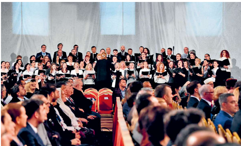
Moment din timpul cântecelor pascale intonate de Corurile reunite ale Arhidiecezei Romano-Catolice de București, Catedrala Națională, 31 mai 2019