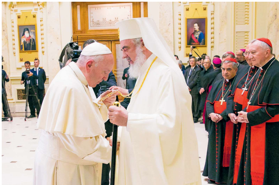
Momente din timpul întâlnirii dintre Sanctitatea Sa Papa Francisc și Preafericitul Părinte Daniel, Patriarhul României, Palatul Patriarhiei din București, 31 mai 2019