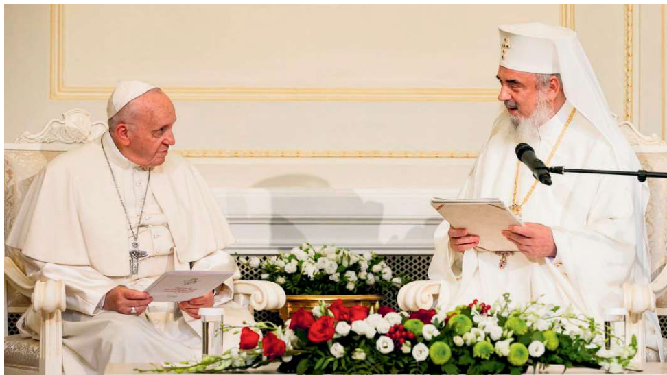
Preafericitul Părinte Patriarh Daniel rostind cuvântul de salut adresat Sanctității Sale Papa Francisc, „Sala Conventus” a Palatului Patriarhiei, 31 mai 2019

În același timp, Evanghelia lui Hristos ne cheamă să promovăm dreptatea, reconcilierea și solidaritatea în societate pentru ca iubirea lui Hristos pentru toți oamenii să fie percepută ca fiind binecuvântare, pace și bucurie, pentru persoane și pentru popoare.