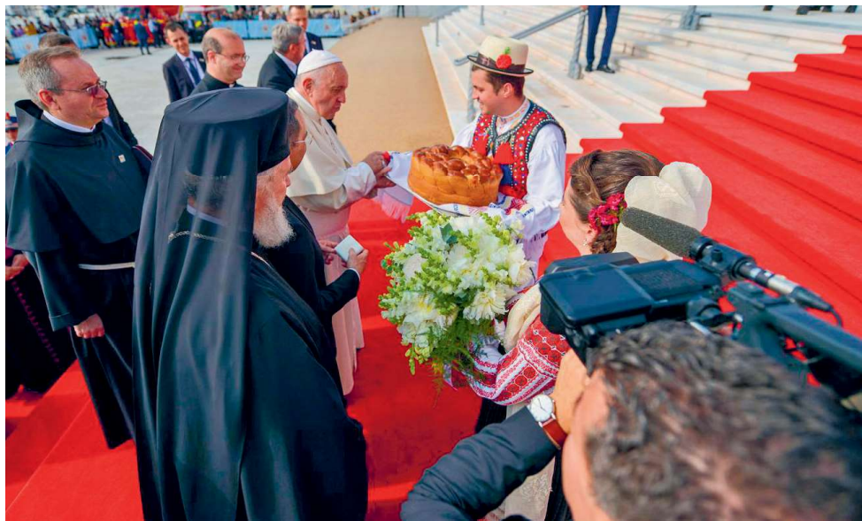
Primirea tradițională românească cu pâine și sare a Sanctității Sale Papa Francisc la Catedrala Națională, 31 mai 2019