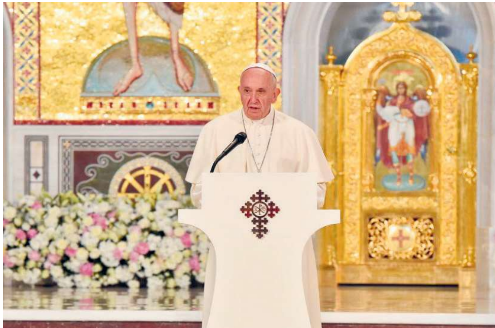
Aspecte din timpul mesajului rostit de Suveranul Pontif în Catedrala Națională, 31 mai 2019