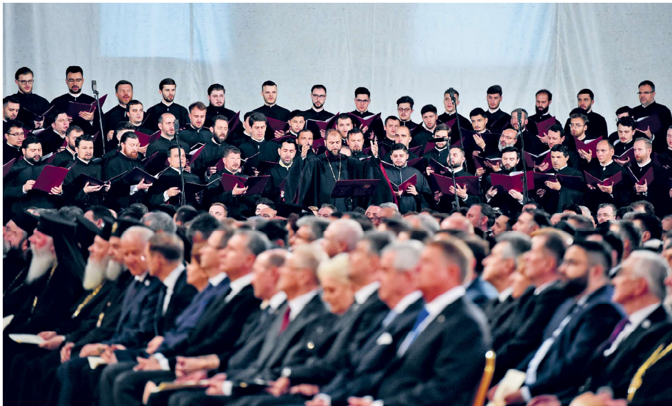
Grupul psaltic Tronos al Catedralei patriarhale interpretând cântări liturgice pascale, Catedrala Națională, 31 mai 2019