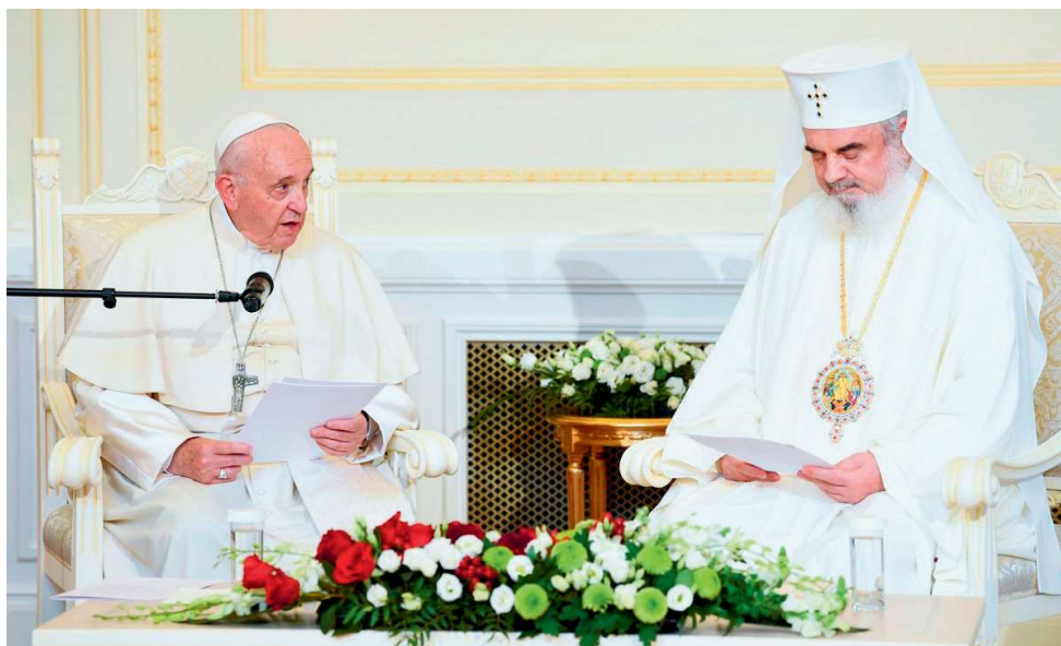
Sanctitatea Sa Papa Francisc în timpul discursului său rostit în cadrul întâlnirii cu Preafericitul Părinte Patriarh Daniel, „Sala Conventus” a Palatului Patriarhiei, 31 mai 2019

Să mergem împreună cu puterea memoriei. Nu cu memoria nedreptăților suferite sau pricinuite, a judecăților și a prejudecăților, care ne închid într-un cerc vicios și ne determină să avem atitudini sterile, ci cu memoria rădăcinilor : a primelor secole în care Evanghelia, vestită cu îndrăzneală și spirit profetic, a întâlnit și luminat noi popoare și culturi; a martirilor din primele veacuri, a Sfinților Părinți mărturisitori ai credinței, ai sfințeniei trăite zilnic și propovăduite de atâtea persoane simple care împărtășesc același Cer. Datorită lui Dumnezeu, rădăcinile noastre sunt sănătoase și puternice și, chiar dacă crescând au suferit deformările și încercările timpului, suntem chemați, asemenea psalmistului, să ne amintim cu recunoștință de ceea ce Domnul a făcut în noi, să-i înălțăm Lui un imn de laudă unii pentru ceilalți (cf. Psalmi 77, 6, 12-13 ). Amintirea pașilor făcuți împreună ne încurajează să înaintăm spre viitor având conștiința diferențelor, cu siguranță, dar mai ales regăsind mulțumirea atmosferei de familie, reînsuflețind memoria comuniunii care, ca o făclie, să lumineze pașii drumului nostru.